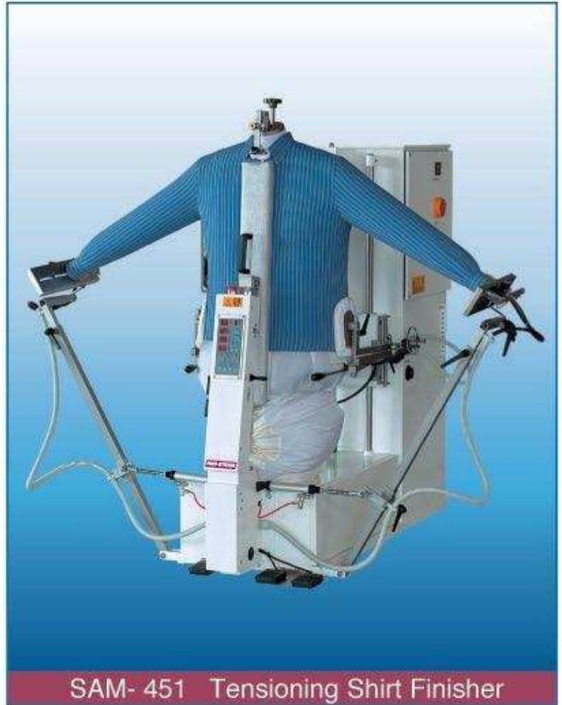
SAM- 451 Tensioning Shirt Finisher